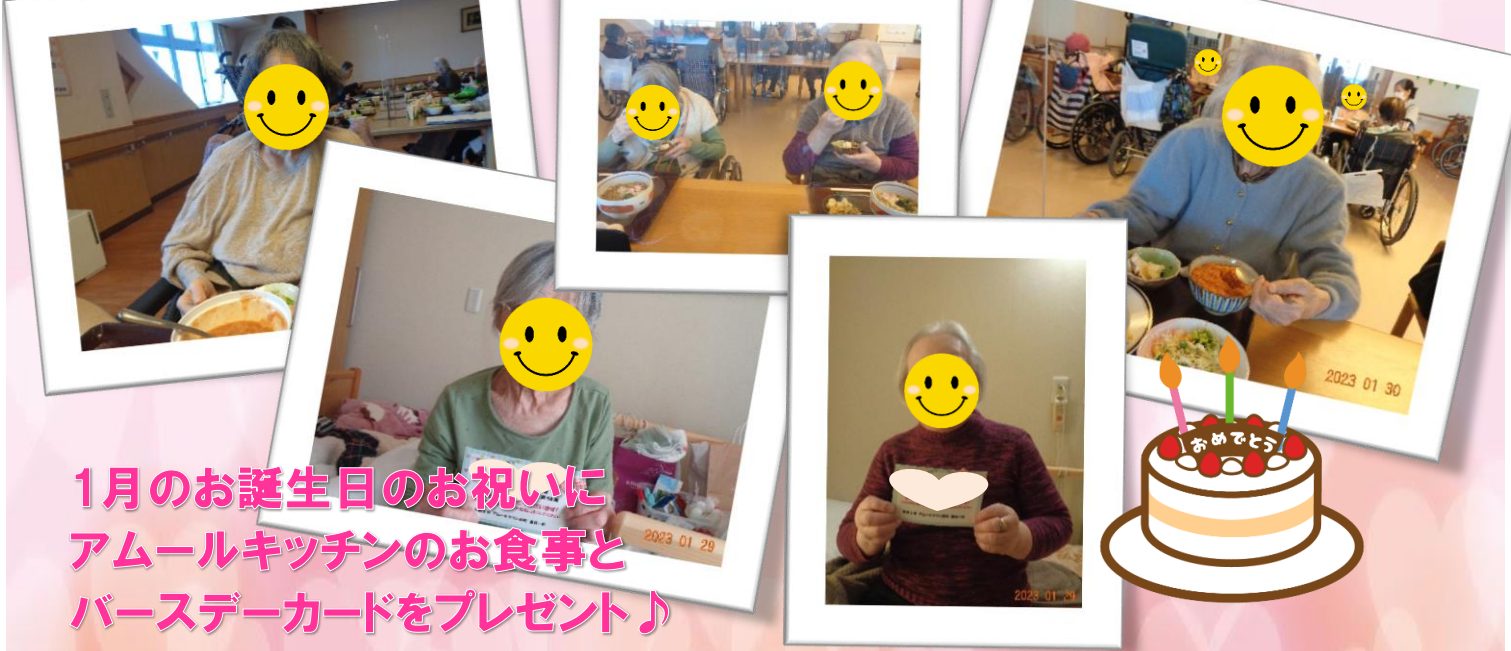
1月のお誕生日のお祝いに アムールキッチンのお食事と バースデーカードをプレゼント♪