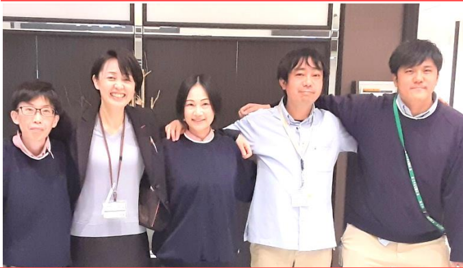
すべては「ありがとう」のために

私たちの施設理念は「ありがとう」の心を大切に... 私たちスタッフは、常に「ありがとう」の気持ちを忘れずに、日々仕事にやりがいを持ち、共に学び成長を目指します。