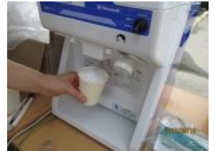
冷え冷えジュース